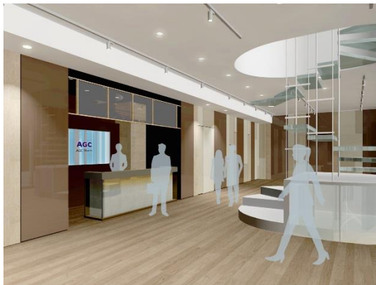
1F：ブランド発信フロア「Solution Cafe」

AGCグループの先端技術や新商品などを展示するほか、お客様とのコミュニケーションを促進する様々なイベントを開催する空間です。素材に触れ、また体感していただくことで新たなインスピレーションが生まれ、ビジネスが展開していく場を目指します。