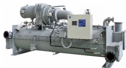
ノンフロン高効率ターボ冷凍機 RTBA 型

荏原冷熱システム及びAGCは、それぞれの技術・製品により、冷凍・冷蔵・空調分野でお客様の地球温暖化の抑制に貢献していきます。